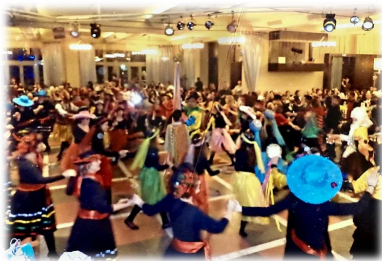
Αποκριάτικος Χορός Λ.Ε.Α στον Μύθο.